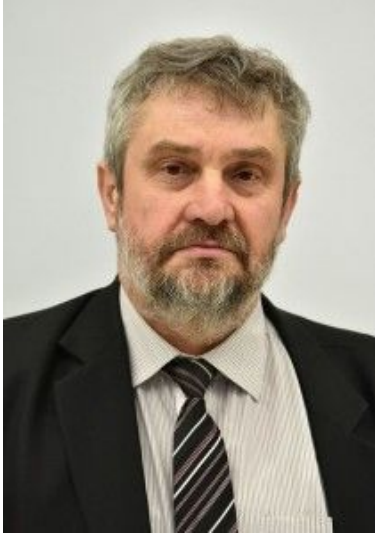
Jan Krzysztof Ardanowski, poseł PiS