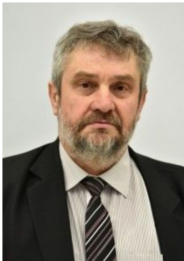
Jan Krzysztof Ardanowski, poseł PiS