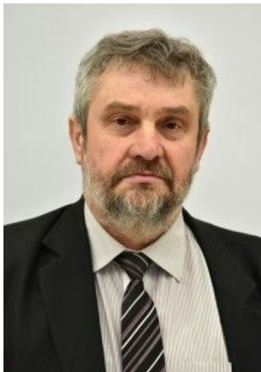
Jan Krzysztof Ardanowski, poseł PiS