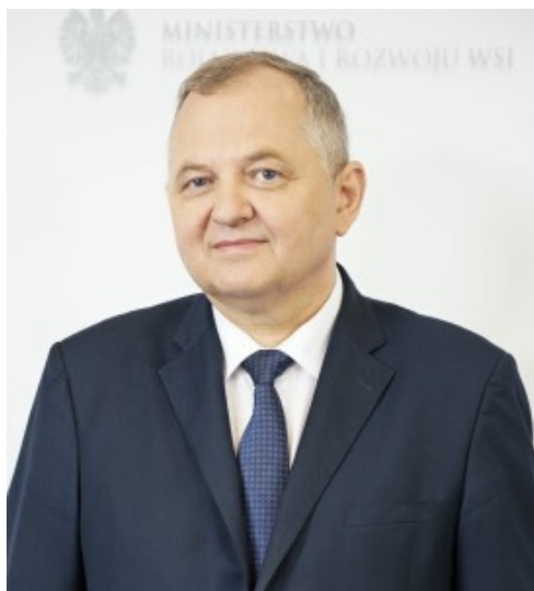
Ryszard Zarudzki, wiceminister rolnictwa

– Myślę, że wszyscy jesteśmy przekonani, że jest to potrzebne i że te zmiany trzeba wprowadzać, w szczególności cyfryzację polskiej wsi, w ramach takiej procedury, aby środki były dostępne szybciej, prościej i żeby ta procedura była jak gdyby w trybie już europejskim – tłumaczył w Sejmie Ryszard Zarudzki wiceminister rolnictwa.