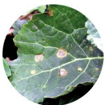
Sucha zgnilizna kapustnych ( Phoma lingam )