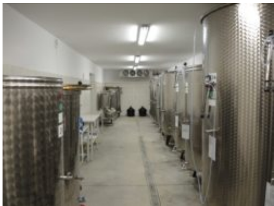
Leżakownia wina w winnicy Golesz

Polscy producenci jednak twierdzą, że produkcja winogron konsumpcyjnych jest nieopłacalna w naszym kraju.