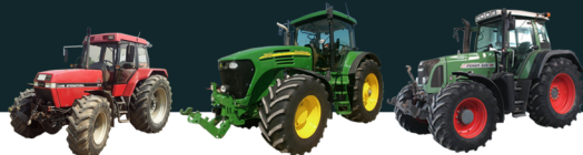
CASE IH 5140